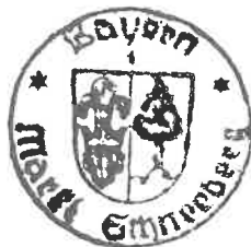
(Trunk) 1. Bürgermeister

Schneeberg, den 17. Oktober 1994 MARKT SCHNEEBERG